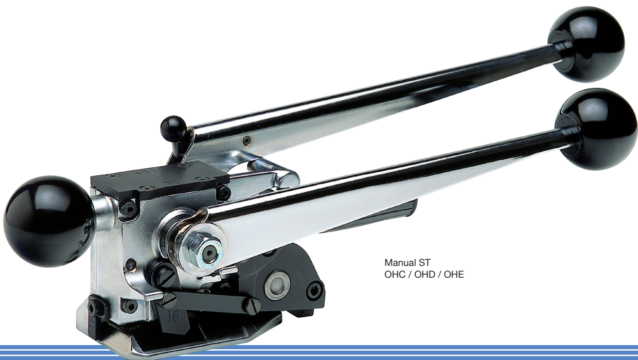
Manual ST OHC / OHD / OHE