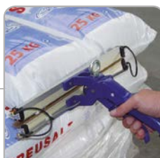
Wieder-Verschließen von angebrochenen Vorrats-Beuteln