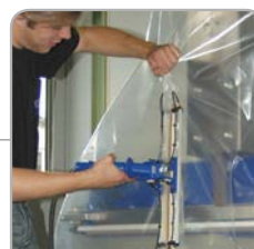
Mobiles Verpacken großer, sperriger Güter